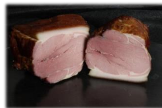
Bauerngeselchtes m. Schwarte