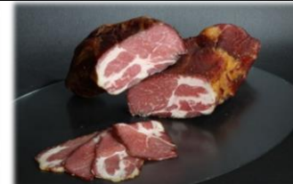
Edel- Selchhals kaltgeräuchert