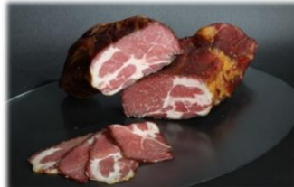
Edel- Selchhals kaltgeräuchert